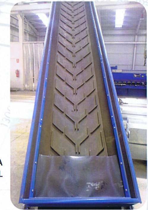
CINTA TRANSPORTADORA PARA SALIDA MATERIAL