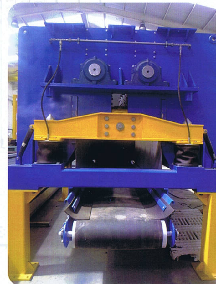
PATAS METÁLICAS PARA ELEVACIÓN DE MOLINO