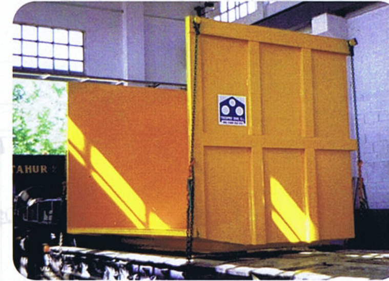
TOLVA SUPERIOR PARA DESCARGA