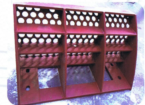
PARRILLAS CON DIFERENTES AGUJEROS

32 Agujeros pasados Ø 33 equidistantes y de los ejes